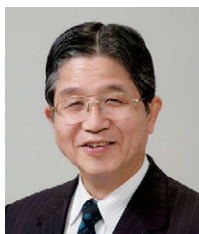
東京理科大学 学長 藤嶋 昭